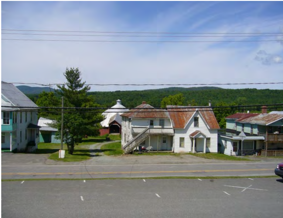
La grange ronde, dont la vue était obstruée par la maison Labbé avant sa démolition en 2011-2012