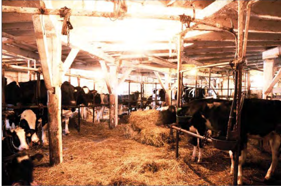
L'étable de la grange ronde

Au niveau du sol se trouve l'étable où le troupeau, composé d'une cinquantaine de vaches, est logé dans des stalles aménagées en cercle autour de petits enclos réservés aux veaux. À l'origine, l'espace réservé aux veaux était occupé par un silo, où l'on entreposait les céréales. Cette ingénieuse disposition réduit le travail requis tant pour nourrir les animaux que pour nettoyer l'étable. L'enlèvement du fumier s'effectue au moyen d'un racloir actionné dans un dalot circulaire, placé derrière les stalles. Ce système a disparu lors de la restauration récente de la grange de Mansonville.