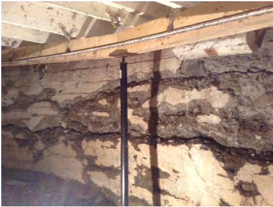
Les fondations fissurées de la grange ronde

La restauration de la grange ronde de Mansonville constitue un projet ambitieux, qui comprend les éléments suivants : remplacement des vieilles fondations fissurées qui risquent de provoquer l'effondrement du bâtiment , redressement et consolidation de la structure, réparation du parement extérieur, des portes et fenêtres, et réfection de la toiture, tout cela dans le but de sauvegarder ce bâtiment patrimonial pour les générations futures.