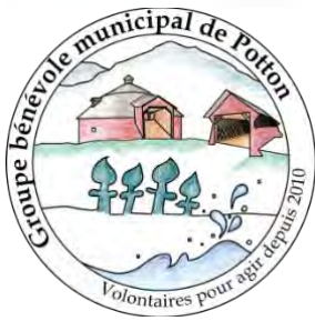
Groupe bénévole municipal de Pottton