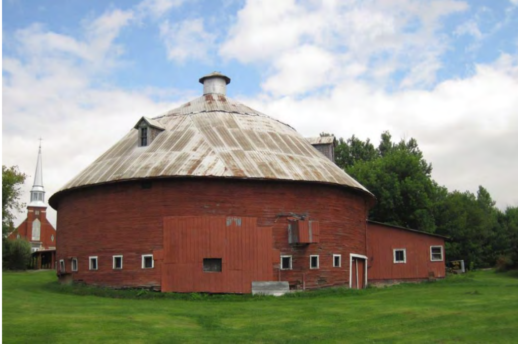
La grange ronde, avant sa restauration

La restauration et la mise en valeur de la grange ronde ont pour but d'en faire un centre d'interprétation de l'histoire et du patrimoine agricole, bâti et paysager du canton de Potton. Déjà de 2012 à 2016, avant la restauration du bâtiment, l'Association y présente des expositions durant l'été.