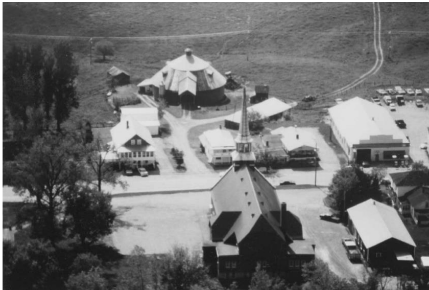
La grange ronde, vers 1968