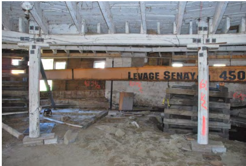
Soulèvement de la grange ronde pour mettre en place les nouvelles fondations