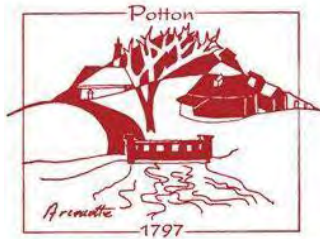
Association du patrimoine de Pottton Pottton Heritage Association