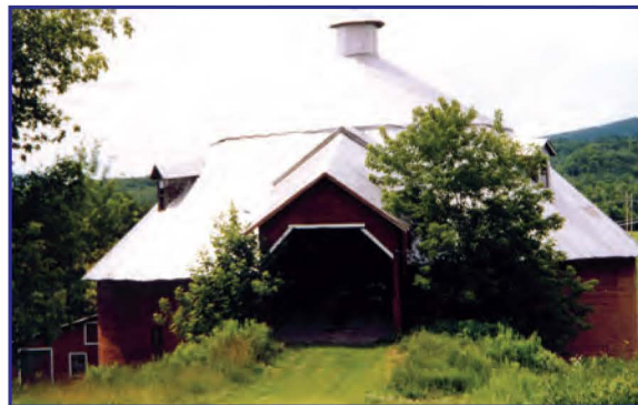
La grange ronde – The round barn