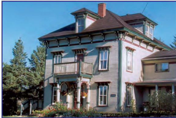
La maison Manson