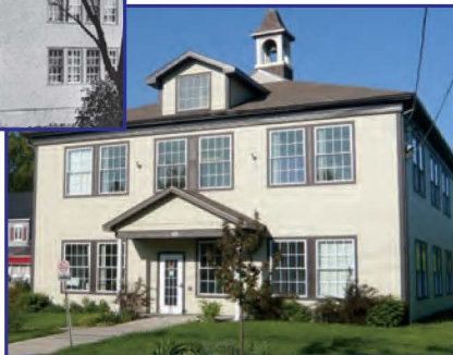
Édifice CLSC - CAB 2010