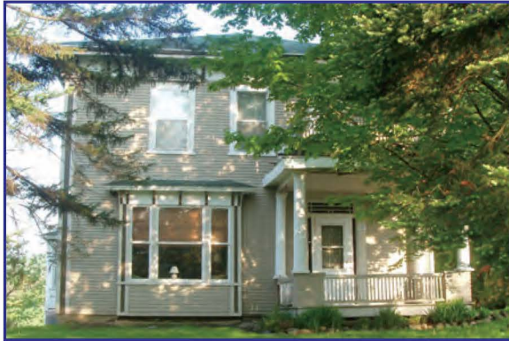
283, rue Principale

En contournant l'hôtel de ville en direction sud, on voit sur la rue Principale l'édifice de la banque et deux superbes résidences d'époque se faisant face.