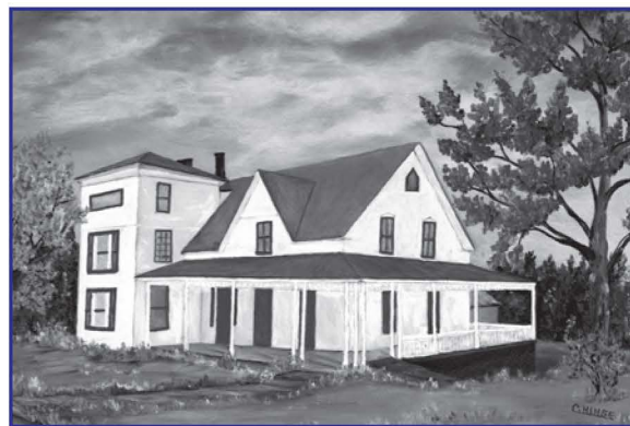
La maison Reilly – Reilly House