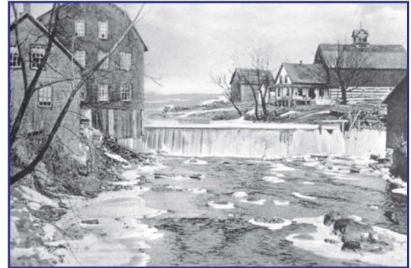
Place du moulin