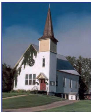
L'église unie – United Church

Quatre églises d'époque, qui témoignent de l'héritage multi-confessionnel de la population de Potton, bordent la rue Principale. Elles ont fait l'objet d'une étude approfondie dans une brochure de la MRC de Memphrémagog traitant du patrimoine religieux de la région. On peut se procurer cette brochure au bureau d'accueil touristique.