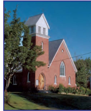
L'église anglicane St. Paul Anglican Church