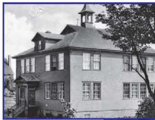
Édifice de la Légion - Legion Hall

L'édifice de la Légion canadienne – Construit en 1922, ce bâtiment servit d'école primaire française jusqu'en 1955. La Légion canadienne acheta l'édifice en 1962 et le CLSC et le Centre d'action communautaire ont occupé les lieux jusqu'en 2008. Un nouvel édifice, respectant l'apparence de l'ancienne structure, fut inauguré en 2010.