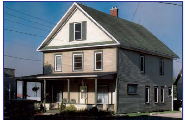
La maison Giroux

Observe the stately residences facing each other at 284 and 283 Main St , on the other side of the street.