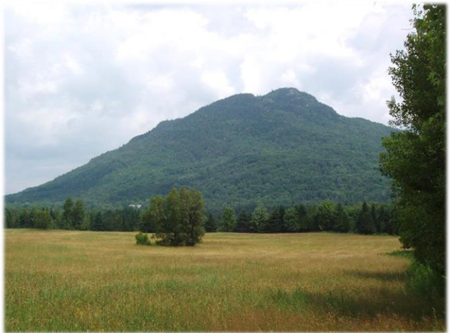
Le mont Owl's Head, vu du chemin Laliberté Owl's Head from chemin Laliberté