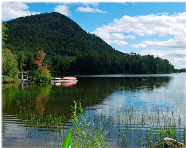
L'Étang Sugar Loaf Sugar Loaf Pond