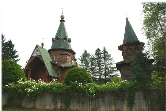
Le monastère russe The Russian Monastery