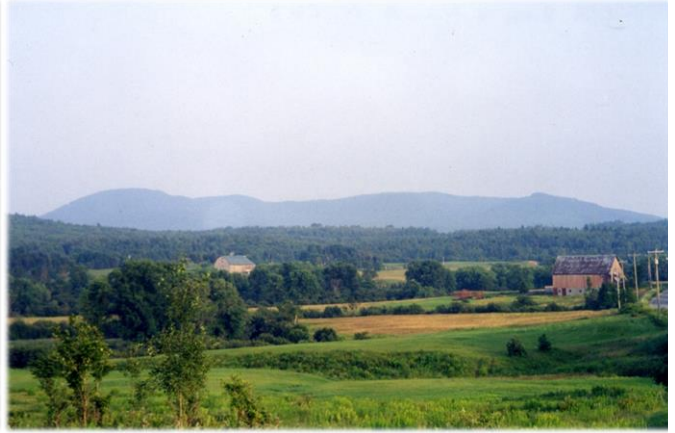
Vue sur la vallée et le mont Bear, de la route 243 View from Highway 243 across the valley towards Mt. Bear