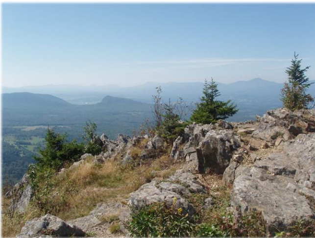
Vue du sommet d'Owl's Head, en direction sud-ouest View from Owl's Head towards the south-west