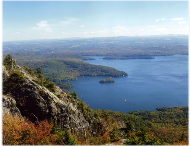
Vue du sommet d'Owl's Head, en direction est View from the summit of Owl's Head towards the east