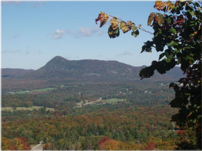
Le mont Éléphant, vu du sommet d'Owl's Head View from Owl's Head onto Mt. Elephantis