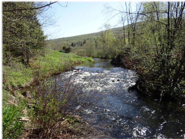
Le ruisseau Ruiter Ruiter Brook Creek