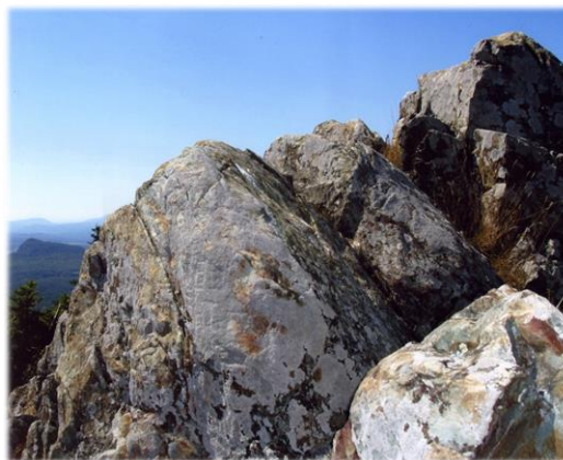
Rochers au sommet d'Owl's Head Rock formation on the summit of Owl's Head