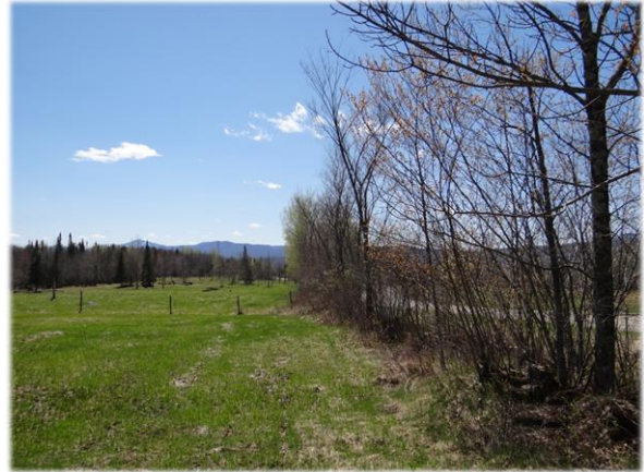
Bande de friche le long du chemin Peabody Brush strip on chemin Peabody