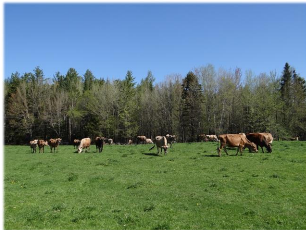
Les vaches laitières de Wayne Bedard – chemin West Hill Wayne Bedard's milk cows – chemin West Hill