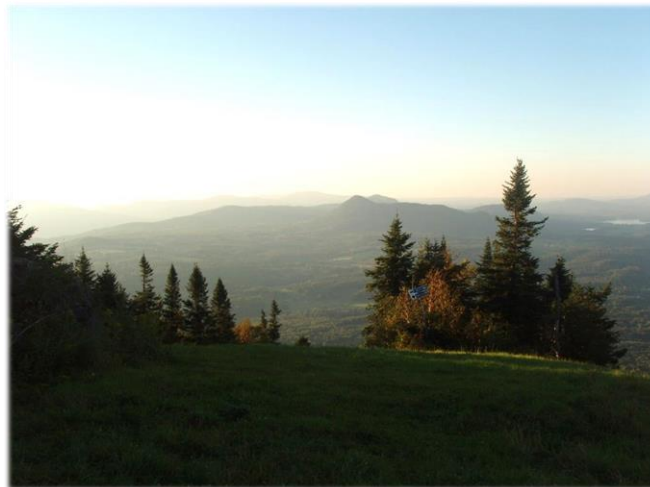
Vue en direction nord, du mont Owl's Head View from Owl's Head towards the north