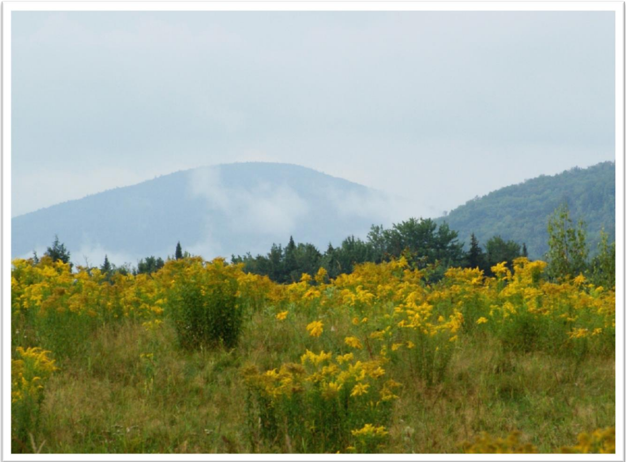
Prairie de verges d'or Goldenrod meadow