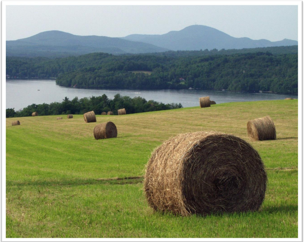
La baie Sargent, vue du chemin du Lac View from chemin du Lac onto Sargent Bay