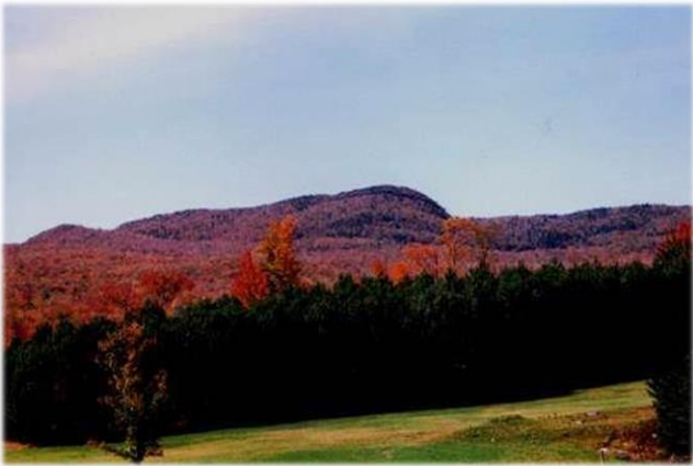
Plantation de conifères discordante Unharmonious pine plantation