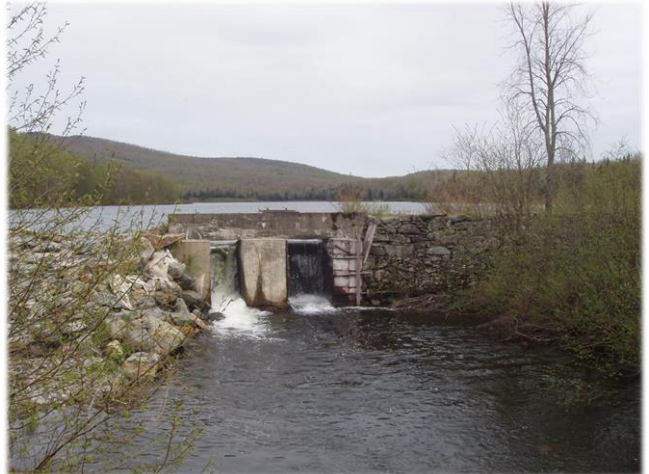
Barrage de l'étang Fullerton Fullerton Pond Dam