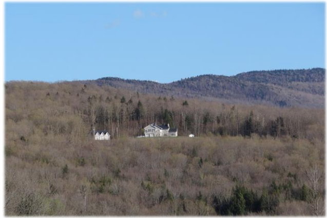
Implantation mal intégrée Poor siting in a natural environment