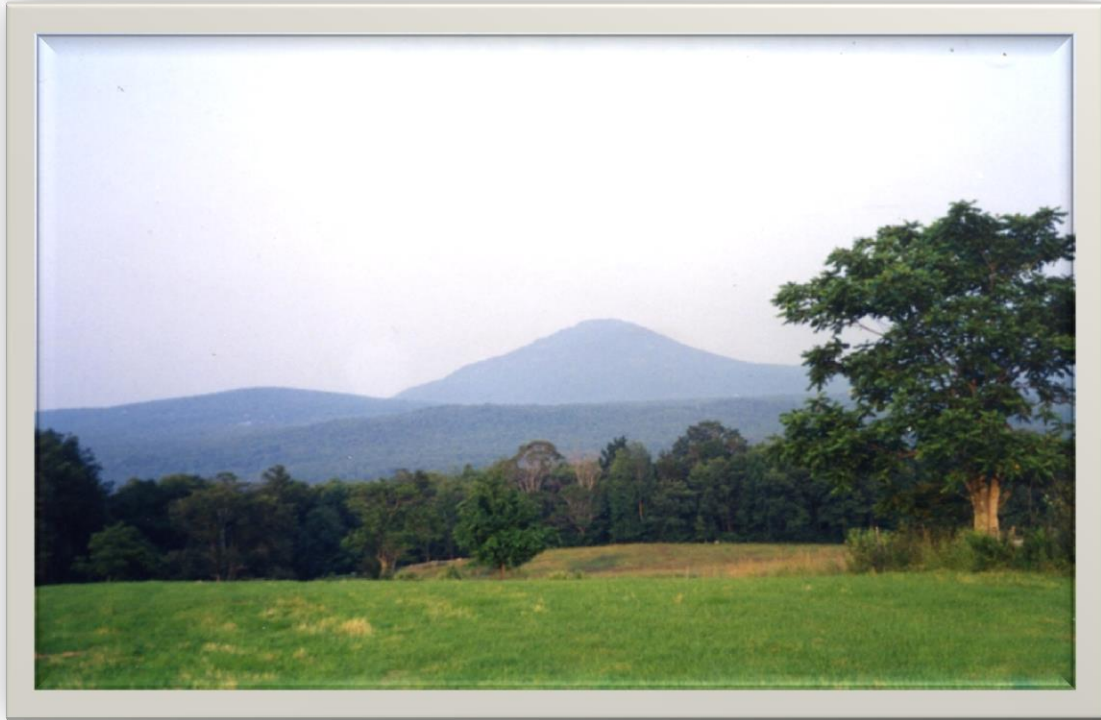
Owl's Head, la montagne magique vue du chemin White