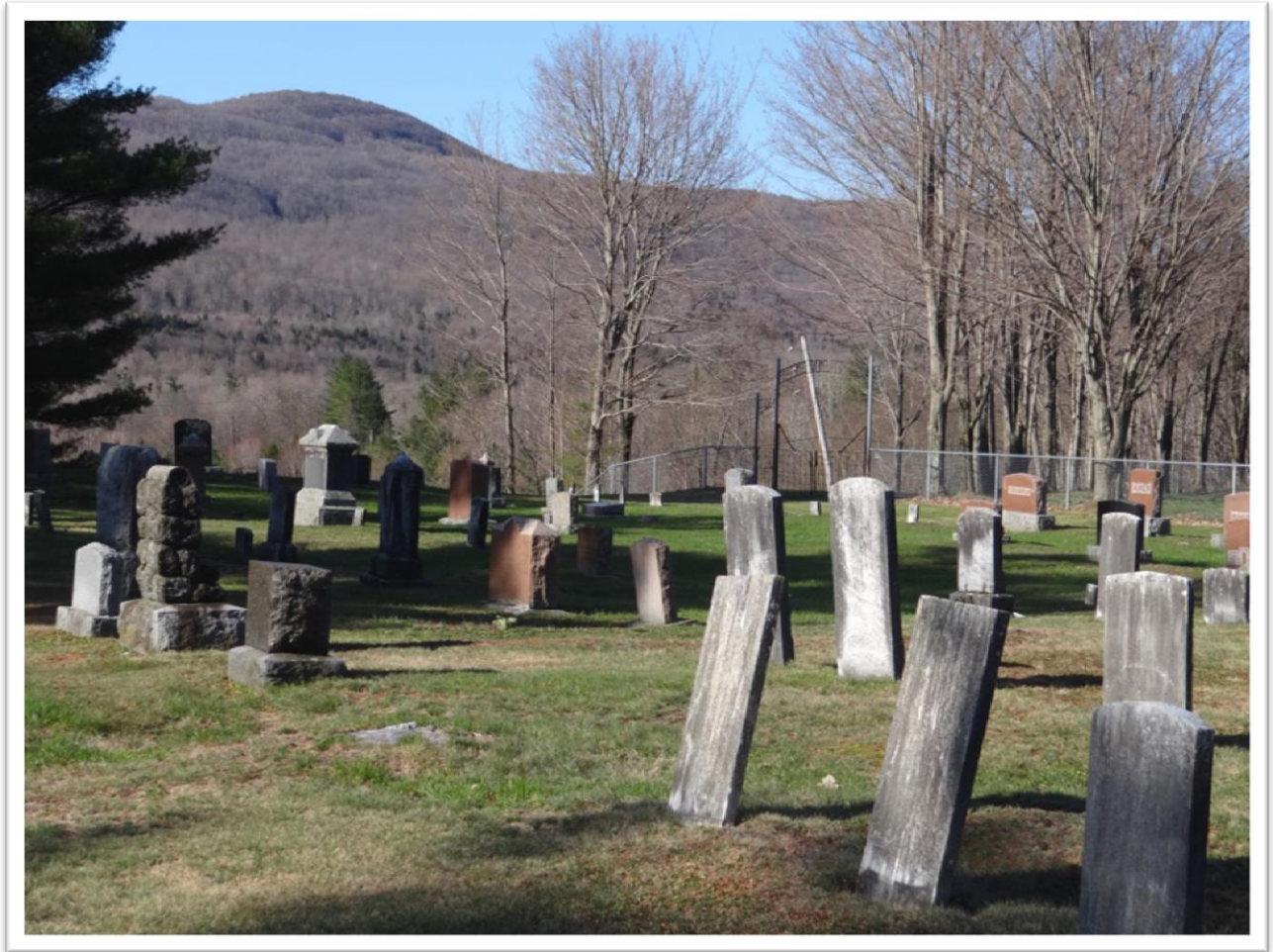
Cimetière Ruiters Settlement, à Dunkin Ruiters Settlement Cemetery at Dunkin