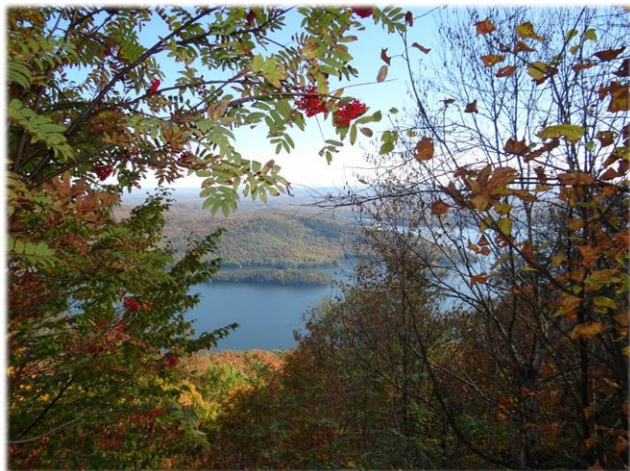
Vue sur le lac Memphrémagog, du sentier Panorama View onto Lake Memphremagog from Panorama trail