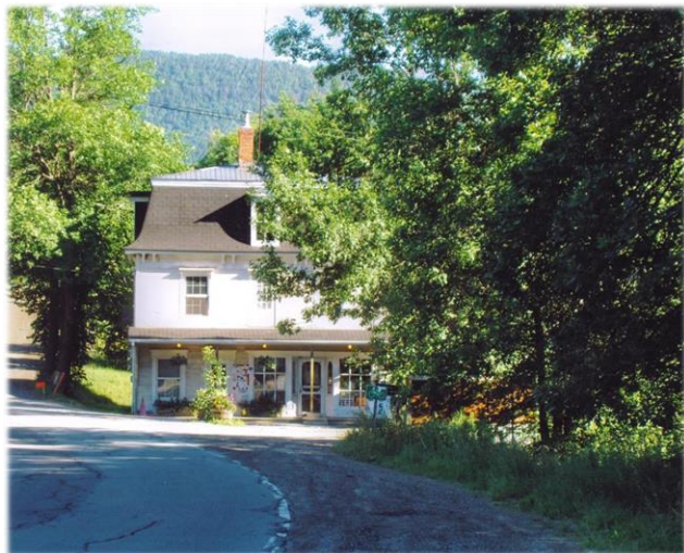
Le magasin Jewett, à Vale Perkins The Jewett Store in Vale Perkins