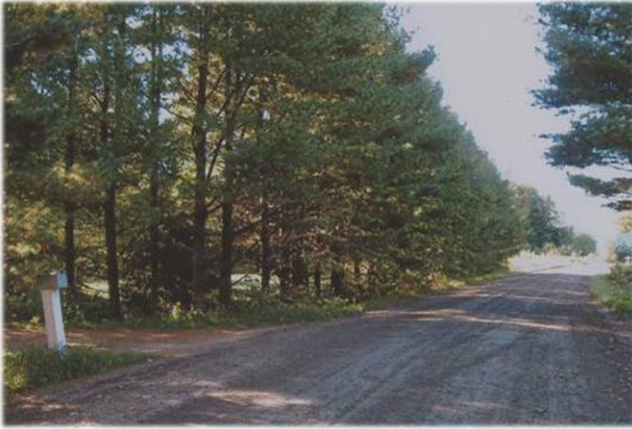
Écran obstructif Inappropriate screen