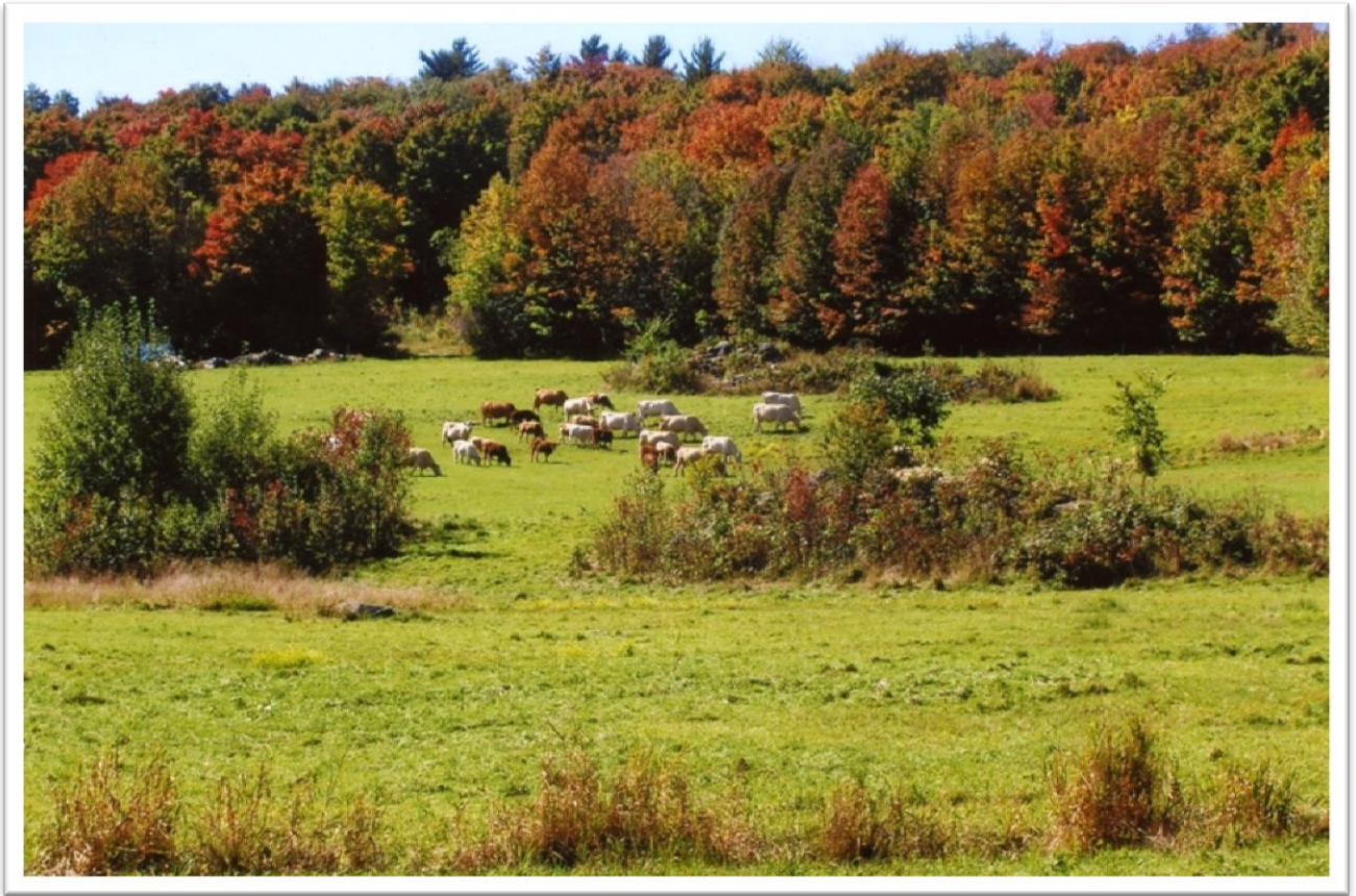
Scène champêtre sur le chemin de Vale Perkins Rural setting on chemin Vale Perkins