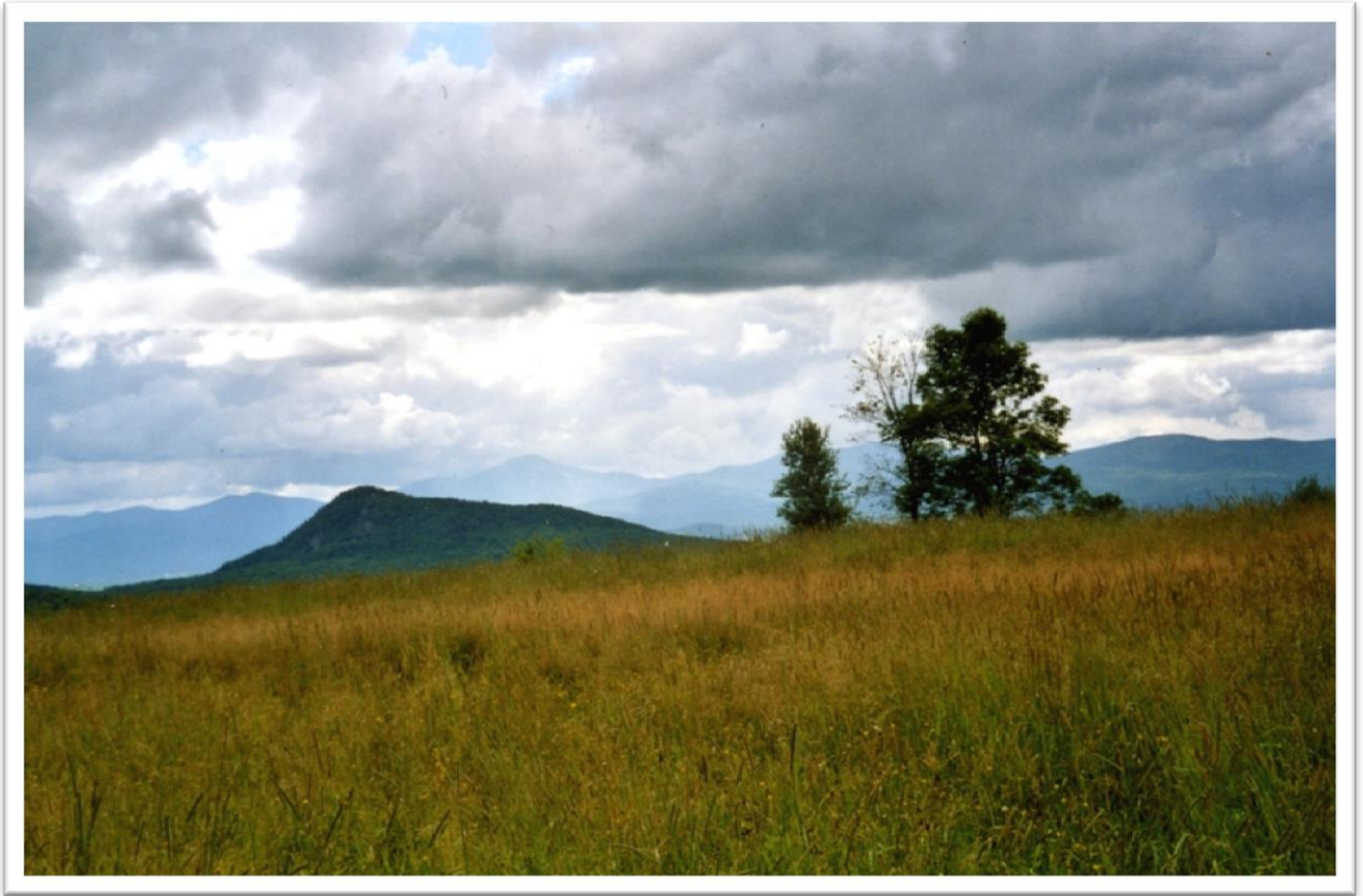
Vue sur le mont Hawk et les Appalaches, du chemin Hill Top View from chemin Hill Top onto Mt. Hawk and the Appalachian Mountains