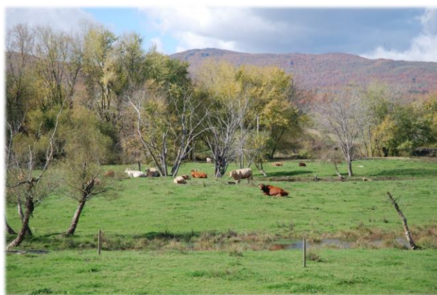
Bovins dans la vallée Missisquoi Cattle in the Missisquoi Valley