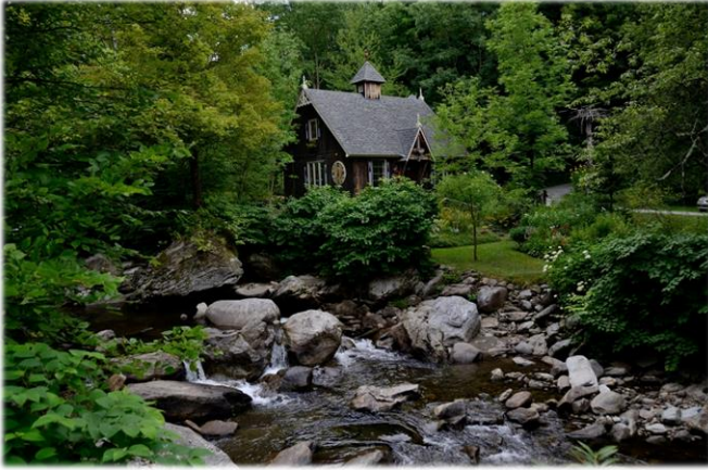
Maison du peintre Craig Skinner, à Dunkin Painter Craig Skinner's house at Dunkin