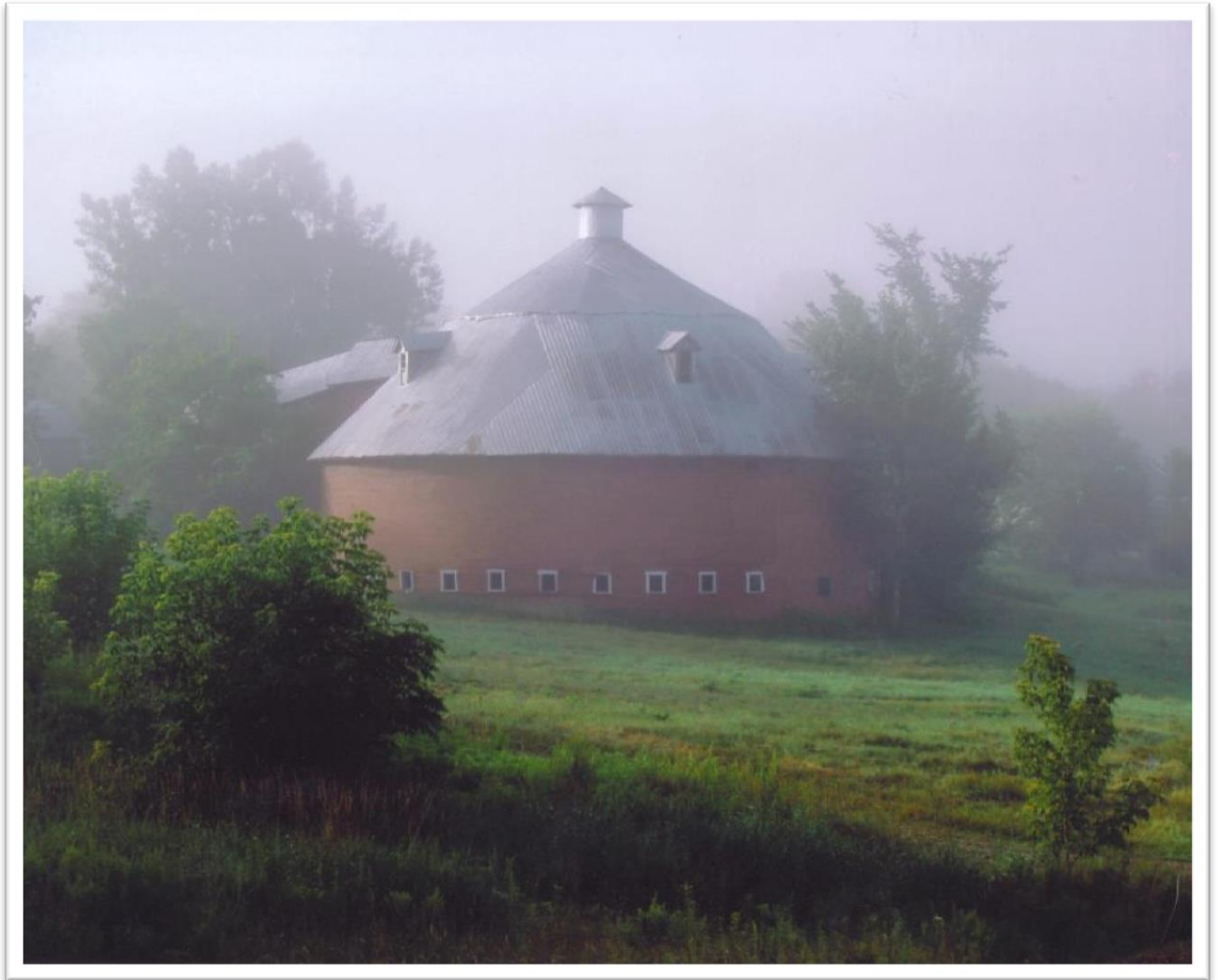
La grange ronde de Mansonville The Round Barn in Mansonville