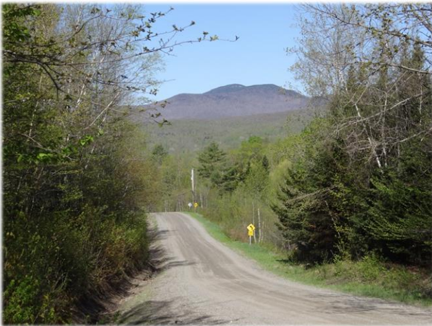
Le sommet Rond des monts Sutton, du chemin West Hill Round Top from chemin West Hill