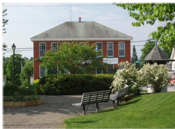
L'hôtel de ville du Canton de Potton The Town Hall of Potton Township