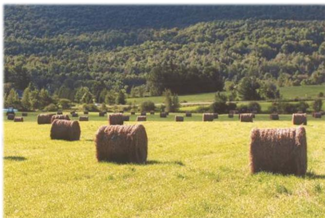
Balles de foin dans la vallée Missisquoi Hay bales in the Missisquoi Valley