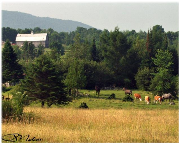
Vue en direction sud-ouest, du chemin Laliberté View towards the south-west from chemin Laliberté