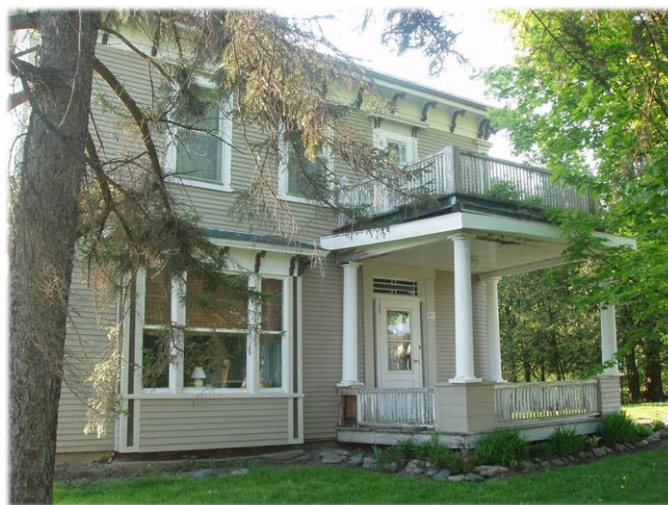
Maison patrimoniale au 283, rue Principale Heritage building, 283 rue Principale