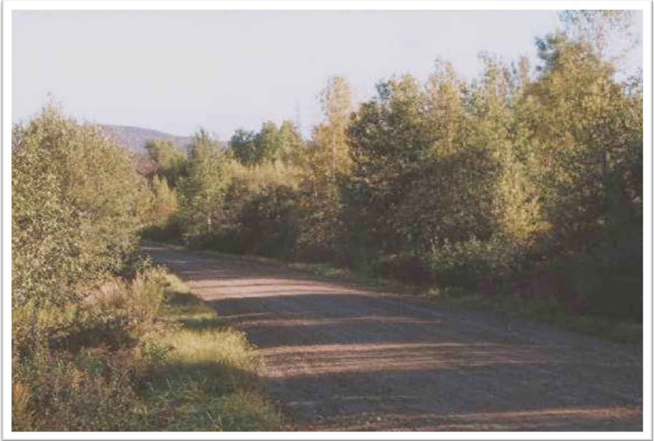
Friche sur le chemin Ruitter Brook Brush along chemin Ruitter Brook