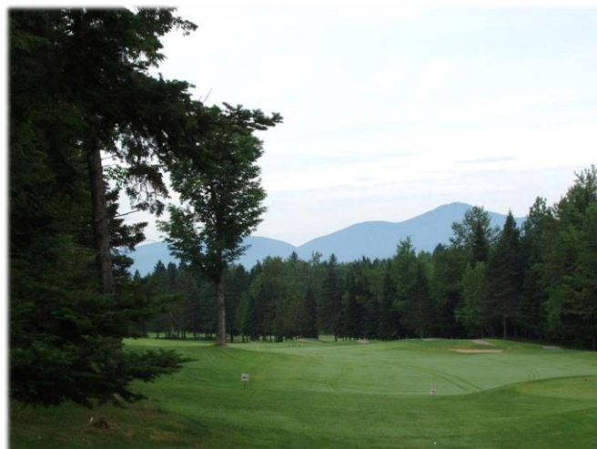
Vue du terrain de golf Owl's Head et de Jay Peak View from Owl's Head golf course towards Jay Peak