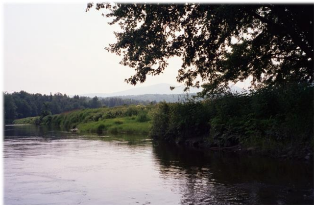
La rivière Missisquoi Missisquoi River