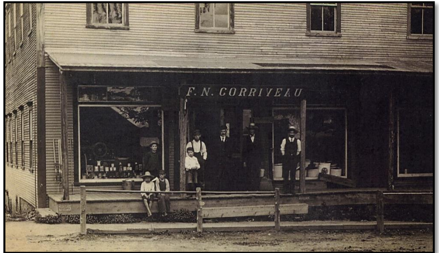
Potton d'antan | Yesterdays of Potton Note the hitching post for horses in the front!