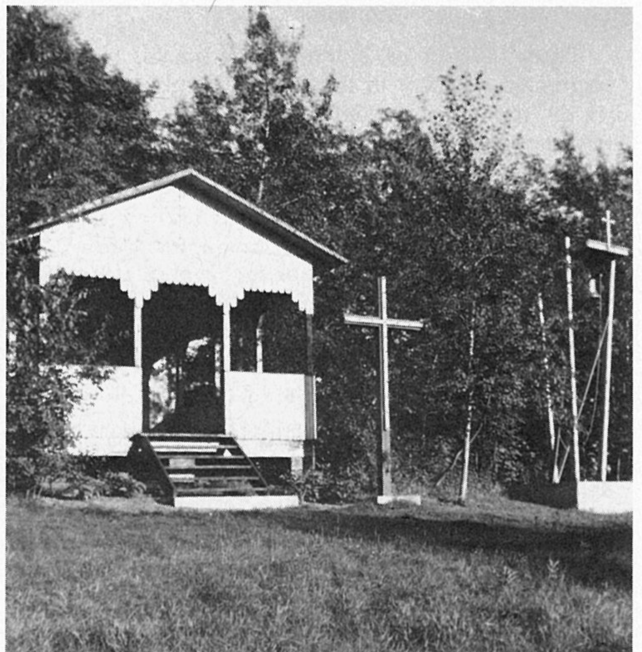
La chapelle du "village Vorokhta" construite en 1954 et dédiée à St-Jean-Baptiste.