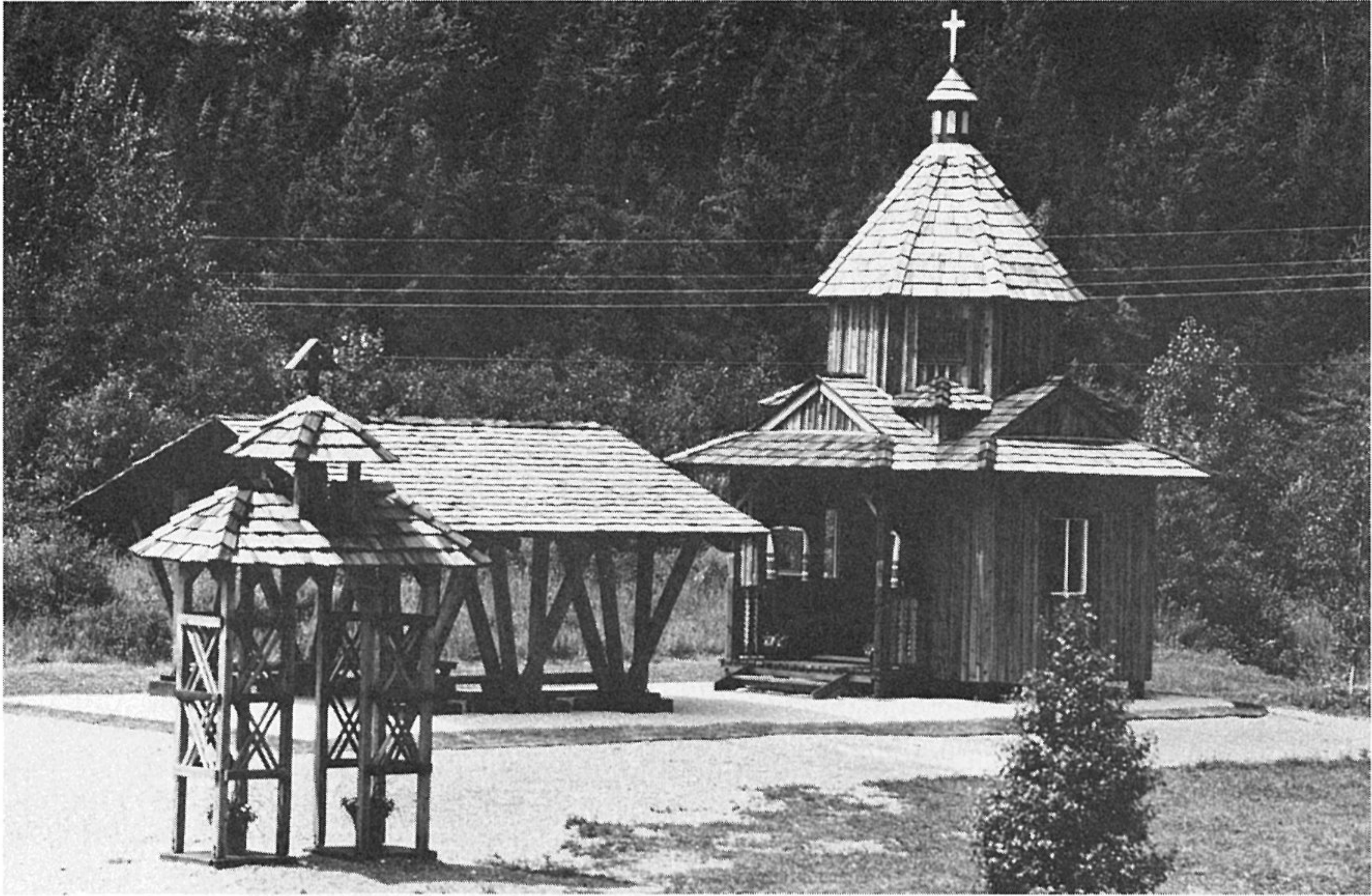
La chapelle Sts. Volodymyr et Olha au camp “Baturyn”, construite en 1980, pour commémorer le millénaire de l’institution de l’Église Chrétienne en Ukraine par ces deux saints.