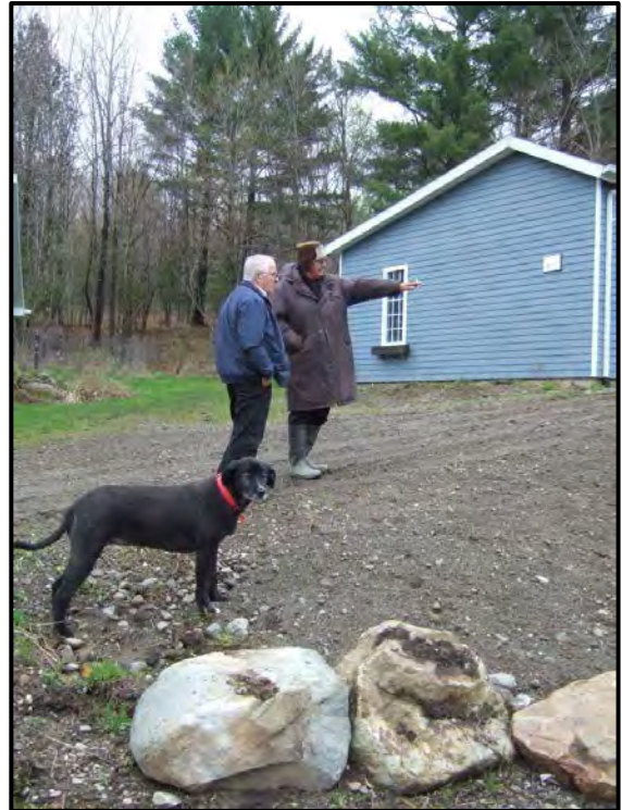
La chienne Mira surveille son domaine