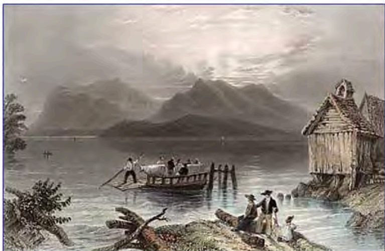
W.H. Bartlett, Copp's Ferry, 1841