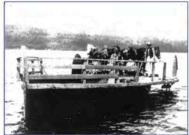
Copp's Ferry, 1841