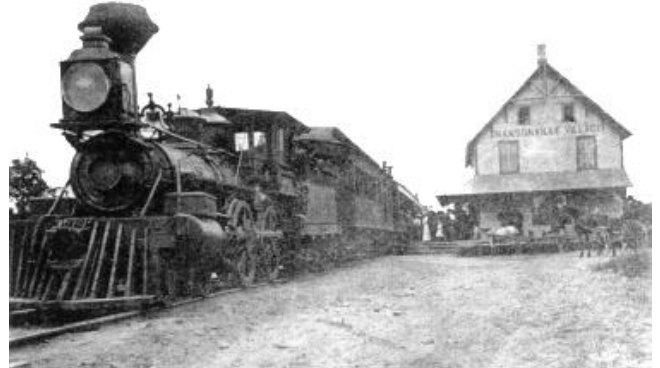
Train du Orford Mountain Railway, à Mansonville Village, vers 1907

emprunté par les trains rapides de Montréal à Boston. Départ de Montréal à 7 h 30 le matin et arrivée à Newport à midi et demi, à moins de partir de Montréal à 3 h 15 de l'après-midi, arrivée à Newport à 8 h 15 du soir.