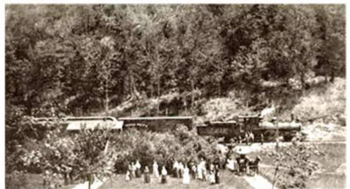
Arrivée du train du CP au Pottton Springs Hotel

En 1878, le Waterloo & Magog Railway, en fait propriété du Vermont Central, relie Saint-Jean-sur-Richelieu via Farnham, Granby et Waterloo, à Magog. La ligne est prolongée jusqu'à Sherbrooke en 1885. Ce sera finalement l'Orford Mountain Railway qui achèvera la liaison ferroviaire entre Eastman, Bolton-Sud et Mansonville en 1907, prolongée à Newport en 1910, sous la direction du CPR.