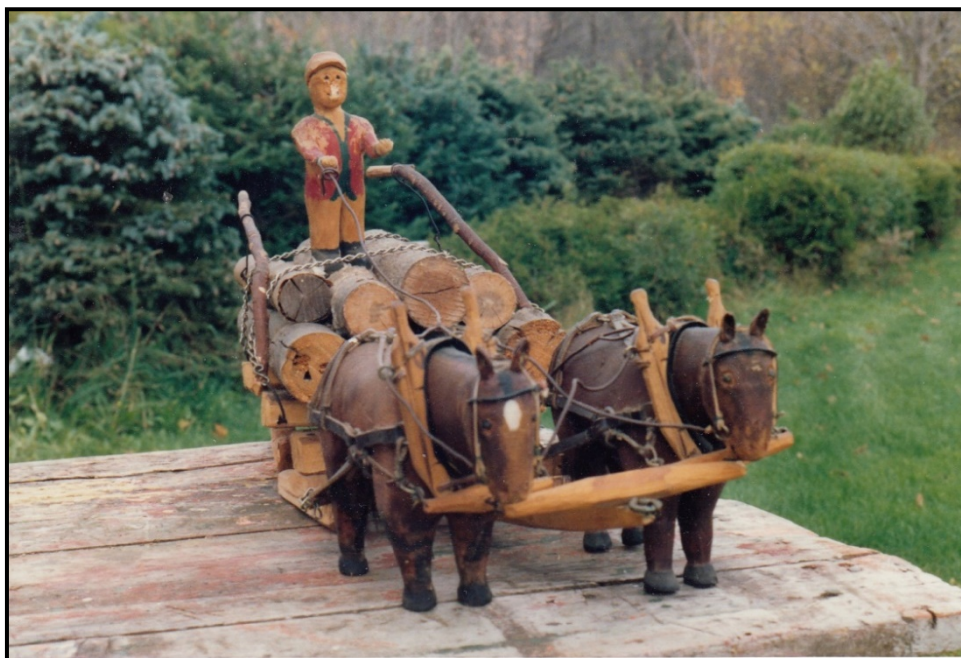
Sculpture de Pete Aiken