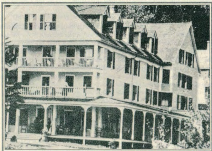
Hôtel Owl's Head Mountain House, circa 1890.