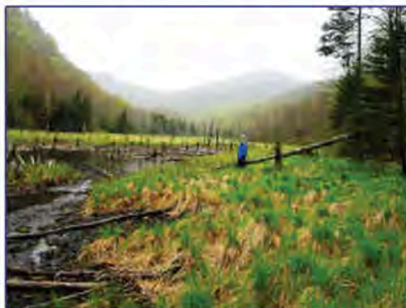
L'étang aux Herbages

La société Domtar exploite les forêts de cette région jusqu'en 2004. Elle cède alors ses propriétés forestières de 60 km 2 à Conservation de la nature Canada. Le coût de la transaction : cinq millions de dollars plus un crédit d'impôt de trois millions.