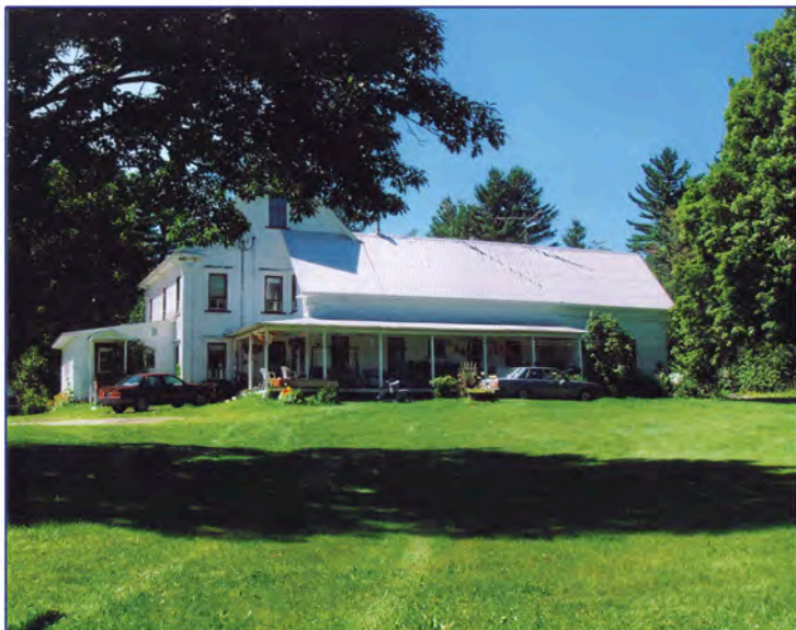
La maison Sherrer