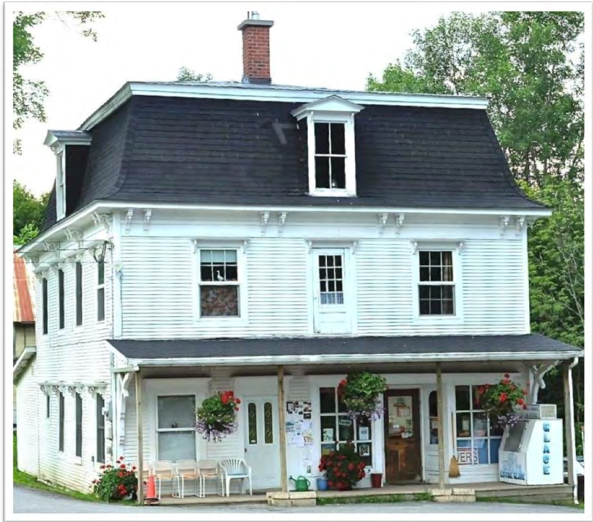
Magasin Jewett – Jewett’s Store 3, chemin George-R.-Jewett, Vale Perkins