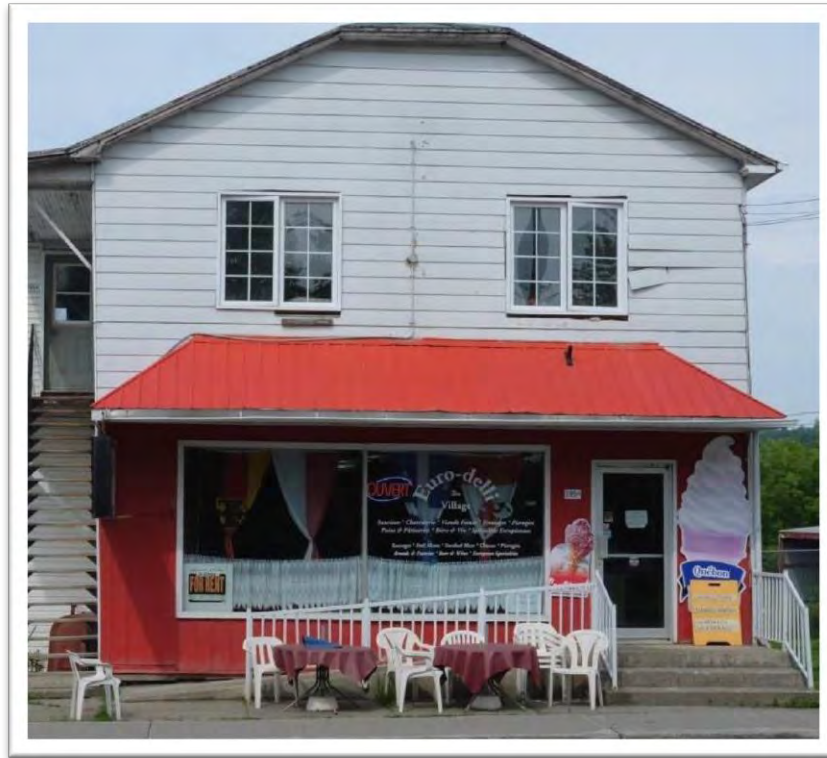
L'Euro-deli, 295, rue Principale