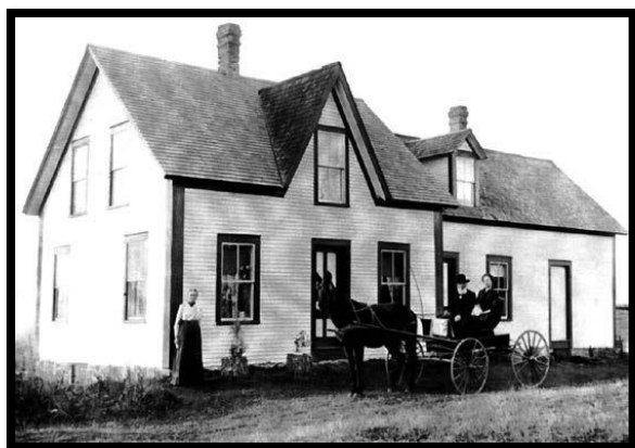
Résidence similaire, en 1897 Similar private residence in 1897