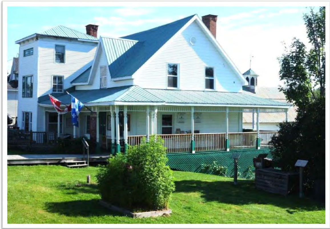
Maison Reilly House, 302, rue Principale