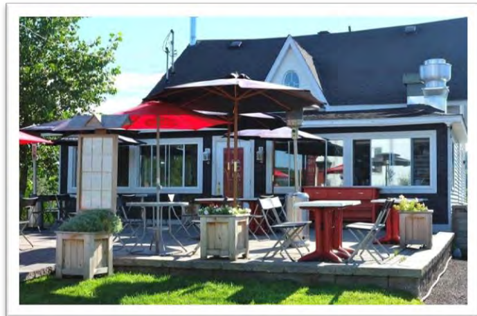
Trattoria Sofia, 304, rue Principale