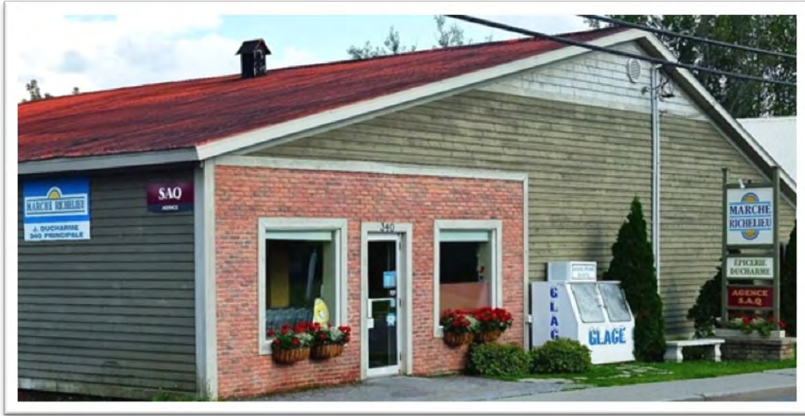
Marché Richelieu, 340, rue Principale