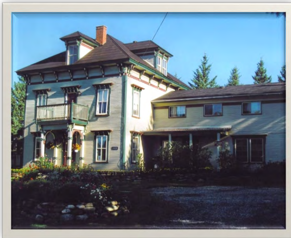
La maison Manson – Manson House