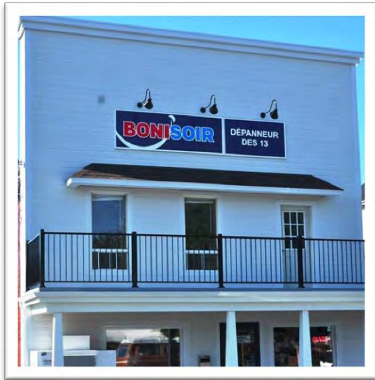
Le BONISOIR, 6, rue de Vale Perkins