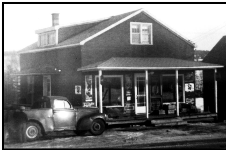
L'épicerie, en d'autres temps The grocery store of another day