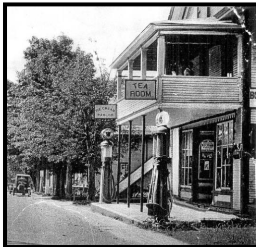
The Tea Room in its early days