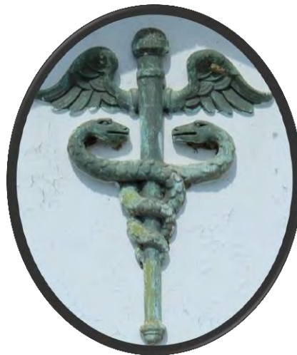
The emblem on the pediment