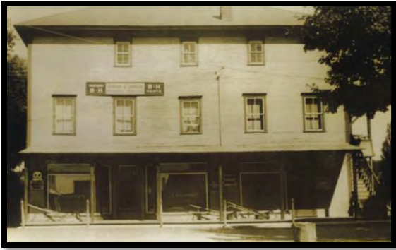
Le magasin général Giroux, vers 1920 Giroux's General Store, circa 1920