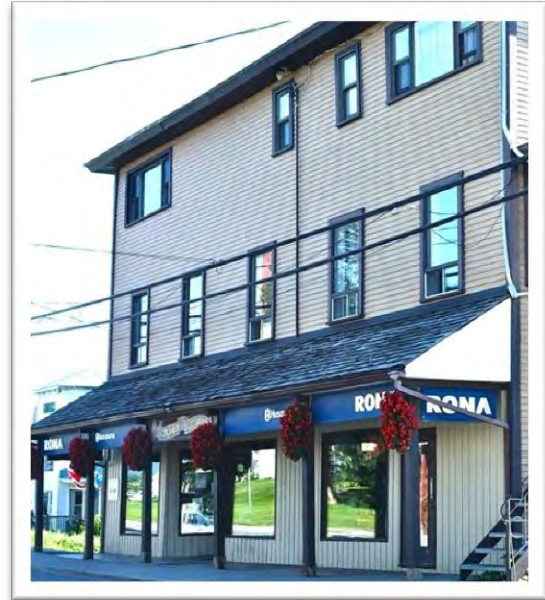
Le magasin Giroux & Giroux, 300, rue Principale