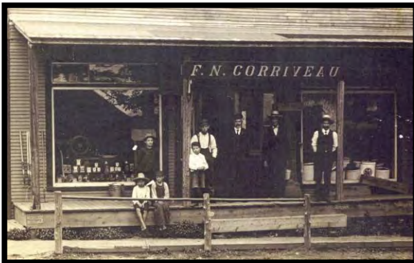
À l'époque de F. N. Corriveau, en 1910 During the time of F. N. Corriveau, in 1910