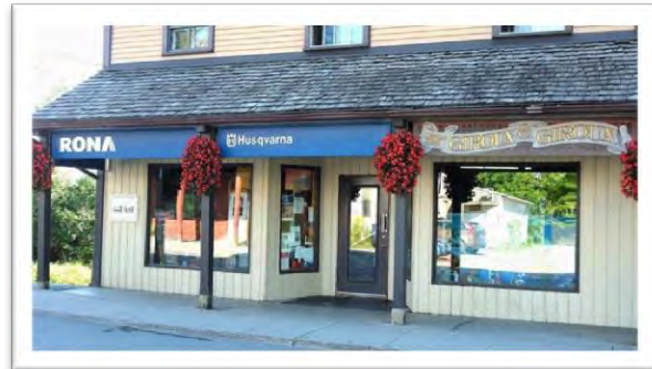
Giroux & Giroux Store, 300 rue Principale