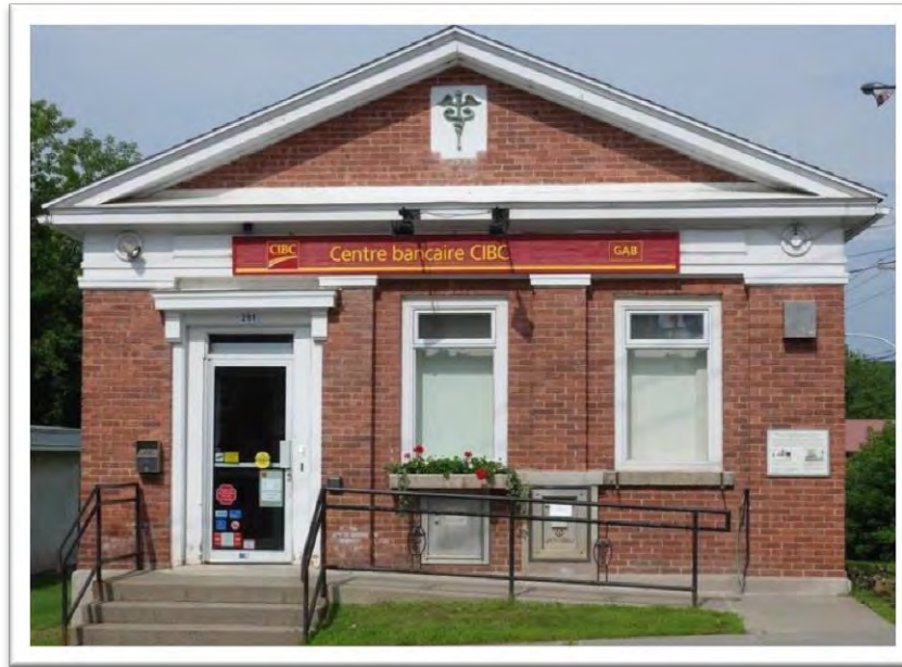
Banque CIBC Bank, 291, rue Principale

Cette succursale de la Banque canadienne impériale de commerce (CIBC) a été construite en 1923 par la Canadian Bank of Commerce (CBC), qui a fusionné en 1961 avec l'Imperial Bank of Canada (IBC) pour fonder la CIBC. Antérieurement, en 1912, la CBC avait intégré l'Eastern Townships Bank (ETB), la première banque à s'installer à Potton en 1904. En 2015, cette institution bancaire dessert donc le Canton depuis 111 ans.