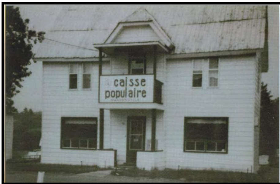
Caisse populaire, 9, rue des Pins

In 1982, it was the Caisse populaire de Mansonville. Since that time, successive amalgamations with Magog and Eastman Caisses populaires have resulted in a name change to Caisse Desjardins du Lac-Memphrémagog, which in 2014 held assets totalling $778 million.