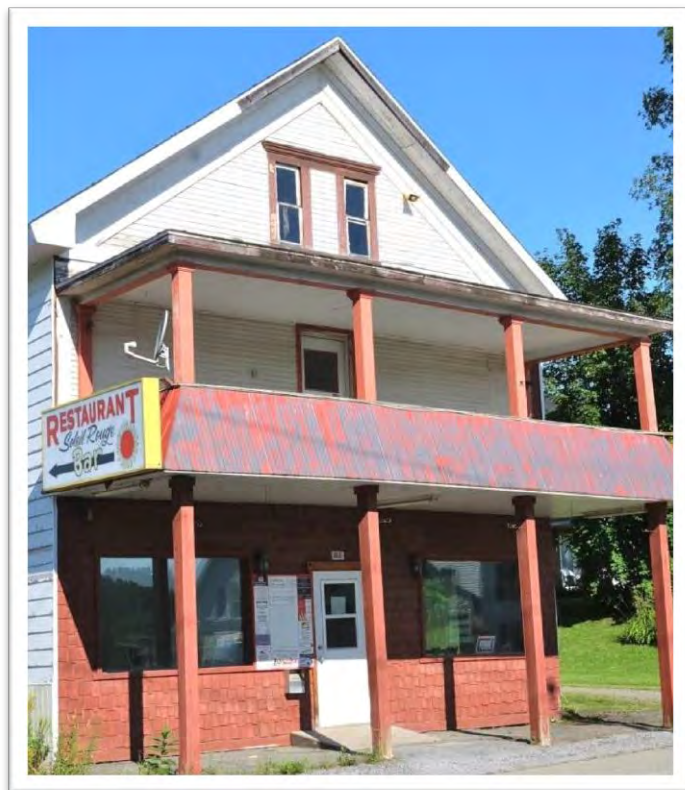
Le restaurant Soleil Rouge, édifice abandonné, 303, rue Principale The Soleil Rouge, abandoned building

Maison d'inspiration Nouvelle-Angleterre, le restaurant Soleil Rouge a fermé ses portes en 2014. Construit vers 1870, le bâtiment a une forte valeur patrimoniale en raison de son ancienneté et de sa situation au cœur du village de Mansonville.