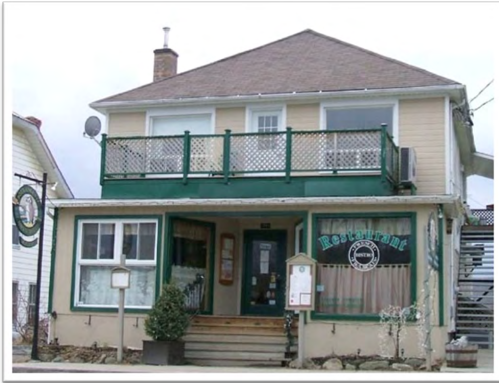
Boulangerie et restaurant Owl's Bread, 288, rue Principale Owl's Bread Bakery and Restaurant

Le bâtiment de type cubique a un toit en pavillon à quatre versants. Ce type de structure est fréquent à Mansonville : Bergeron en a répertorié quatorze exemples.