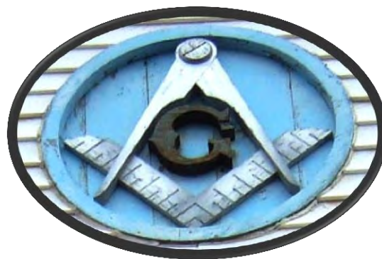
Le salon funéraire Désourdy et la loge St. John n° 27, 4, rue de Vale Perkins Desourdy Funeral Parlour and St. John's Lodge No. 27