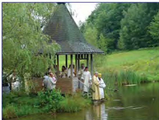
Célébration en 2010